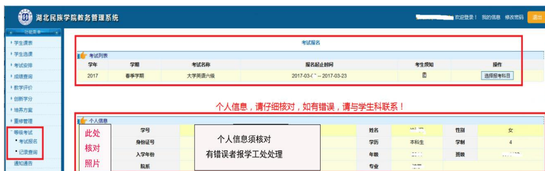
图 1.1 等级考试

第一步、本部学生（含研究生） 登陆湖北民族学院主页，点击右下角的“教学管理”，进入教务处主页，点击右侧“ 教务管理系统 ”； 科技学院学生 登陆 http://10.8.200.54/edu/ 进入“湖北民族学院科技学院教务管理系统”。 用户名 为学号， 密码 为身份证后八位，选择“等级考试”下的子菜单“ 考试报名 ”，阅读 考生须知 ，选择报考科目